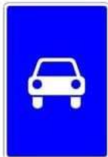
5.3 «Дорога для автомобилей»