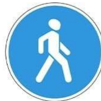
Знак 4.5.1 «Пешеходная дорожка»