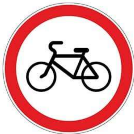
Запрещающий знак 3.9 «Движение на велосипедах запрещено»