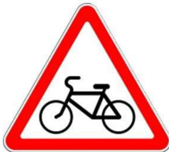
Предупреждающий знак 1.24 «Пересечение с велосипедной дорожкой»