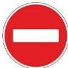
Знак 3.1 «Въезд запрещен»